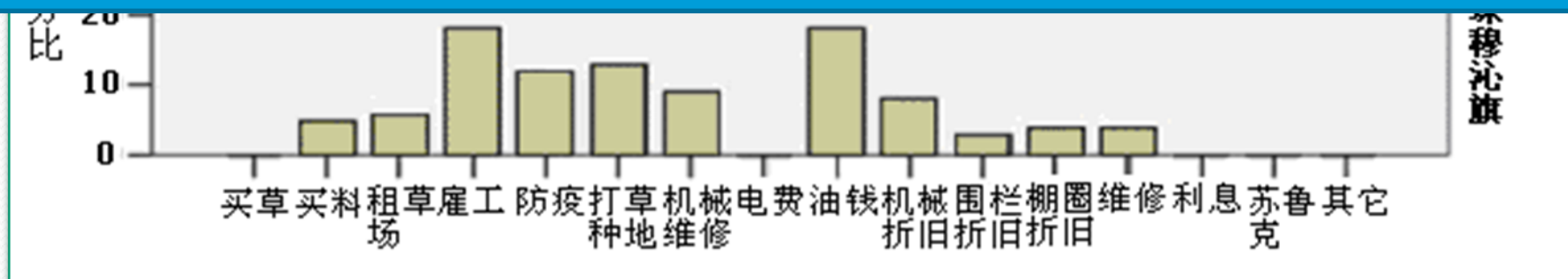
两个区域300羊单位到800羊单位的9户牧户成本结构对比

西部区的牧民超过三分之一的成本都花在买草上，买料成本也占到10%以上。东部区主要成本是雇工支出和油钱。